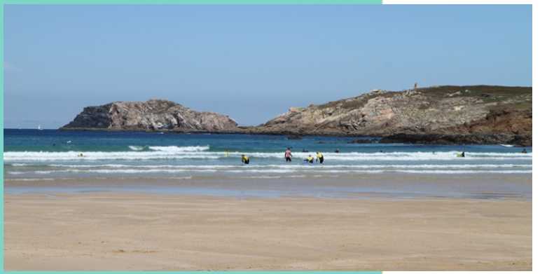
Illas Gabeiras e Punta do castro de Lobadiz, desde a praia.