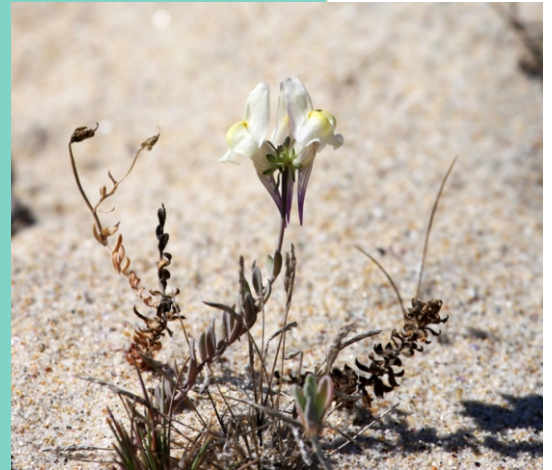
Paxariños ( Linaria Polygalifolia subs. Aguillonensis )