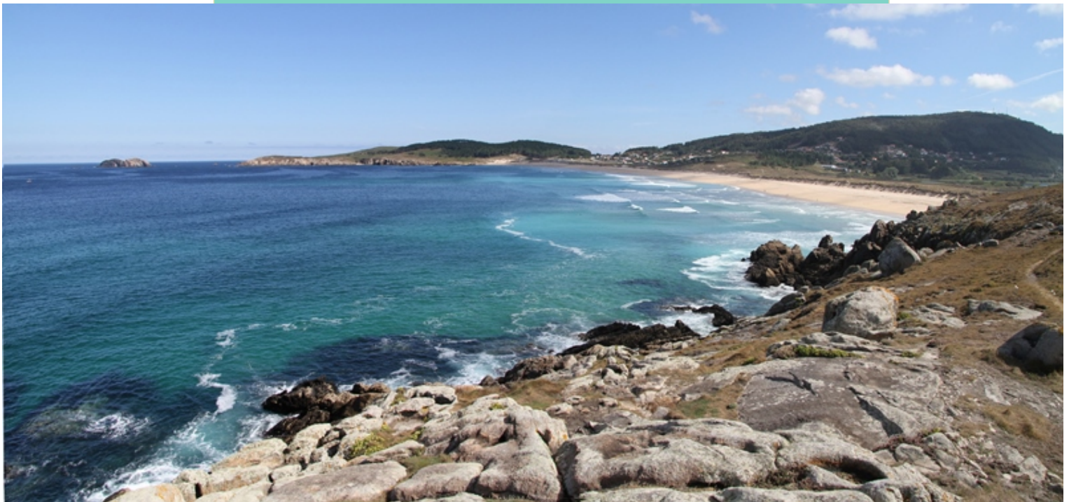
Vista desde a Punta Penencia