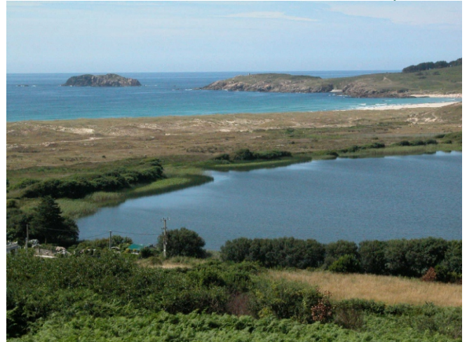
Vista da lagoa de Doniños, a praia, a punta do Castro e as illa Gabeiras.

Nas dunas e praias consérvase unha variada flora adaptada á vida nos areais, con algunhas especies de interese, como algunhas orquídeas e Omphalodes littoralis , subs gallaecica , un endemismo galego das costas da Coruña.