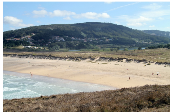
Praia e duna (a lagoa detrás do sistema dunar)