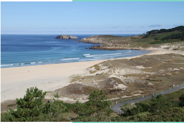
Vista desde a Punta Penencia