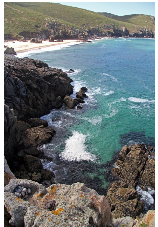
Punta Penencia e praia de Lumbobó.