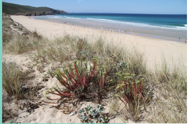
Vexetación das dunas.