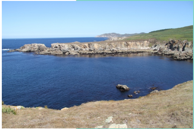
Vista cara ao norte desde a Punta do Castro.